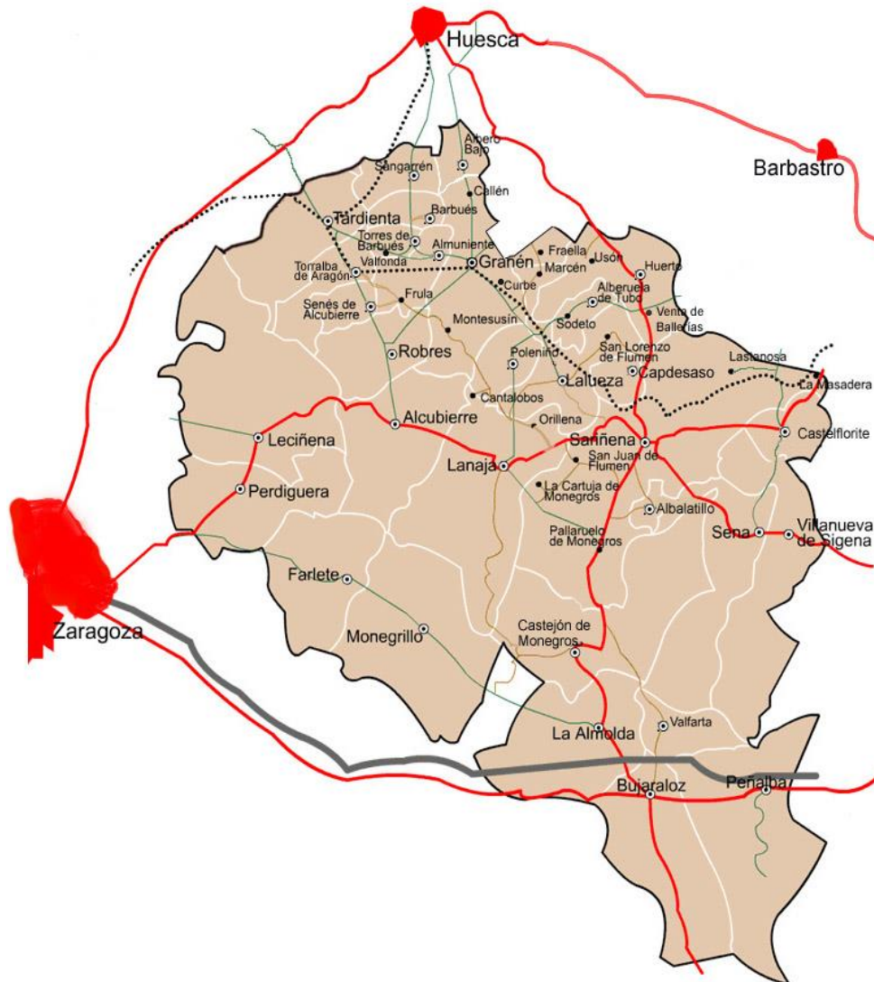
[ Imagen 1: Mapa con las poblaciones de Los Monegros ]

Monegrillo, Peñalba, Perdiguera, Poleñino, Robres, Sangarrén, Sariñena (La Cartuja de Monegros, La Masadera, Lastanosa, Pallaruelo de Monegros, San Juan del Flumen y Barrio de la Estación), Sena, Senés de Alcubierre, Tardienta, Torralba de Aragón, Torres de Barbués (Valfonda), Valfarta y Villanueva de Sigena.